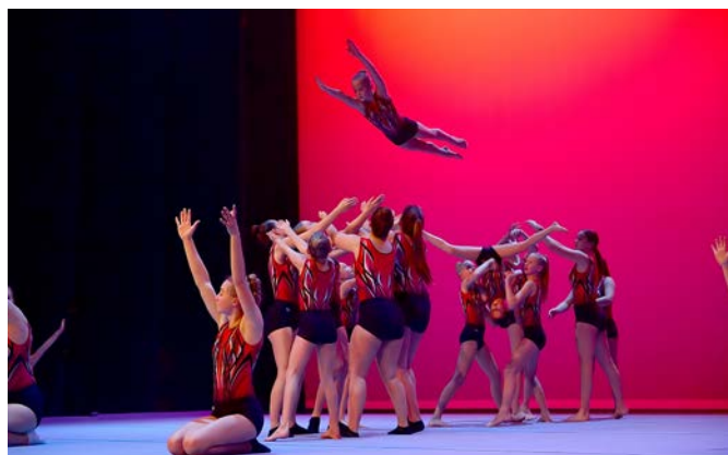
DANSEN, SPRINGEN EN VLIEGEN; ALLE GYMNASIEKELEMENTEN WAREN AANWEZIG IN DE SPETTERENDE SHOWS.